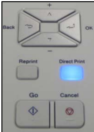
Funktionstastenfeld des Druckers

Mit den Tasten "+" & "-" kann zwischen den einzelnen Optionen gewechselt werden. Zur Auswahl einer Option drücken Sie die Taste "OK" oder drücken Sie zum Abbrechen des Vorgangs die Taste "Back". Nachdem Sie die gewünschten Optionen gewählt haben, drücken Sie "Go" und wählen Sie zum Drucken die Anzahl der Kopien. Falls Sie keine Einstellungen festgelegt haben, werden die Standardeinstellungen verwendet.