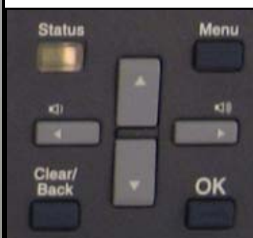
Funktionstastenfeld des Flachbetts