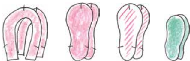
Ткань для верха

Соединяющие метки наносите исчезающим маркером.